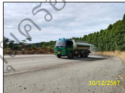
ภาพที่ 1-1 ลักษณะกิจกรรมบริเวณพื้นที่โครงการ